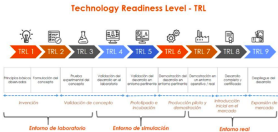
Figura 2 Technology Readiness Level – TRL